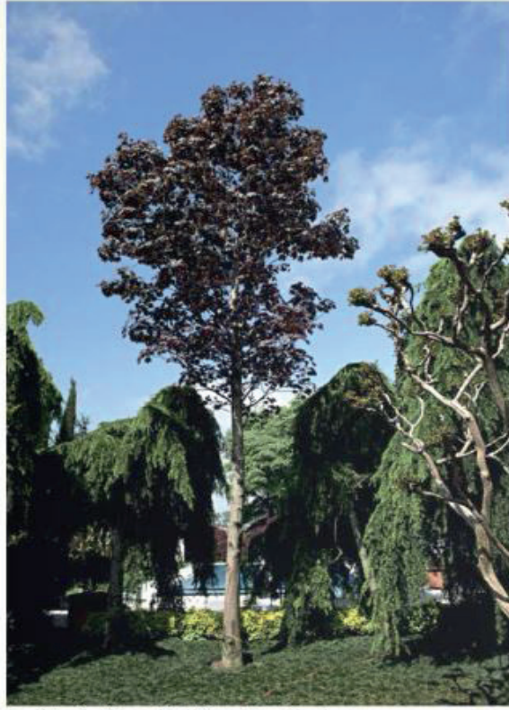
Acer Flabratoides "Crimson King" (Kırmızı Norveç Çınarı)

kolleksiyon oluşturmuş Bilginsoy: "Ağaç kolleksiyonu"