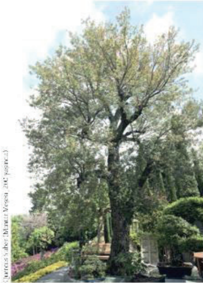
Quercus Sober (Mantar Meşesi, 250 yaşında)