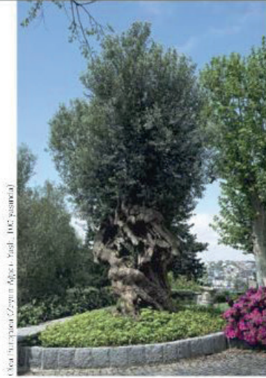
Olea Europaea Zeytin Ağacı, yaş: 100, yaşında

Üçüncü olarak maddi değer ilgi alanımızdadır. Koleksiyon parçaları bu yönden ele alındıklarında bize çok şey ifade ederler. Ölçeriz, biçeriz ama sonra da