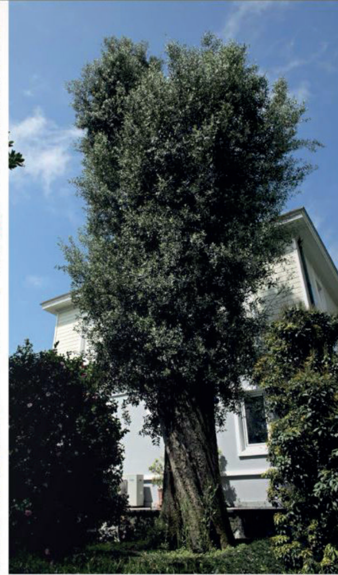
Olea Europaea (Çalkbta bölgesi Zeytin Ağacı, 700 yaşında)