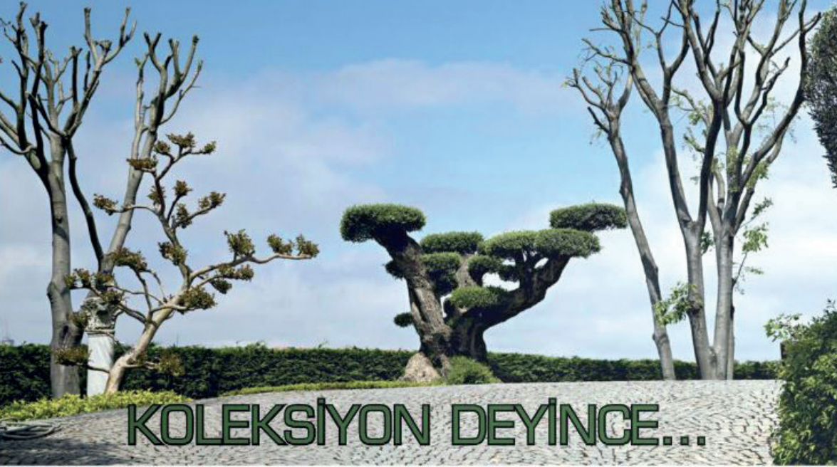
Olea Europaea Bonsai (Colt yaşlı Bonsai Zeytin, 600 yaşında), Calne Australis (Adi Çalınbük) sağ ve soldaki ağaçlar.

Mert SANDALCI Araştırmacı-Yazar 1974 İskenderiye Mezunlu