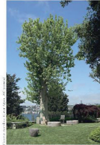
Platanus acerifolia, Kınar Ağacı, yaş: 200, yaşında