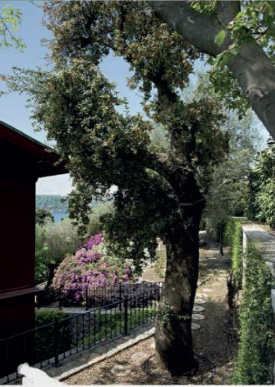
Quercus Sober (Mantar Meşesi, 250 yaşında)