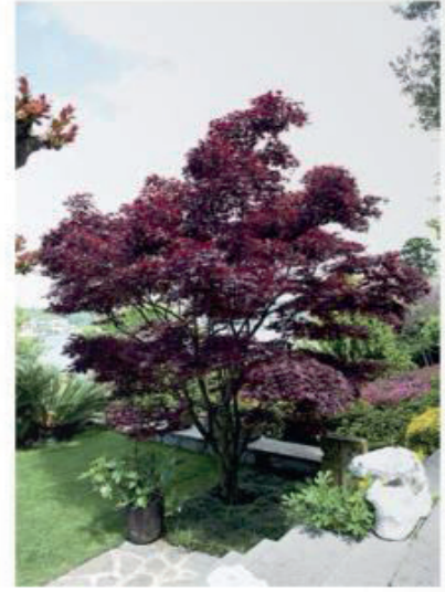
Acer Flabratoides (Japon Akasyası, 30 yaşında)